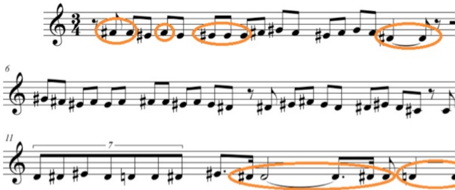
Figura 2: Interpretación de la Debla "En el barrio de Triana".

Dado que no había partituras disponibles, el primer paso que dimos fue el de hacer la transcripción automática a partir de los ficheros de audio. El corpus estaba compuesto de 72 tonás, las cuales incluían deblas, martinete-1 y martinete-2. Para tal fin, usamos el sistema propuesto por Gómez y Bonada [2]. El proceso de transcripción melódica se estructura normalmente en tres pasos diferentes que se pueden ver en la figura 3. Se empieza por una extracción de los descriptores de bajo nivel; sigue una segmentación de notas basada en la posición de los ataques de las notas; y, por último, un proceso de etiquetado de las notas. Véase [2] y las referencias allí contenidas para más información sobre la parte técnica de este algoritmo de transcripción.