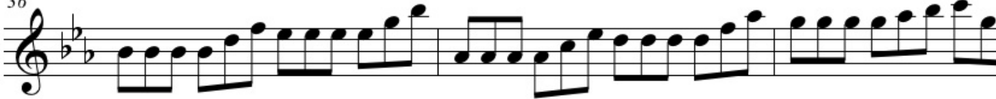
Figure 5: Música 7 del grupo de los Duchs en el concierto de la Universidad Politécnica de Madrid