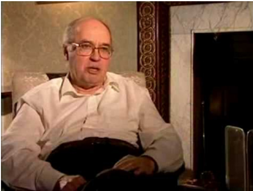
Figura 1: Vídeo de Atiyah hablando sobre la belleza de las matemáticas.