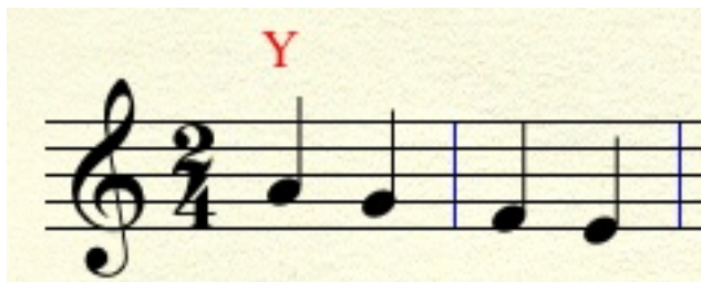
Figura 9: Antecedente y consecuente en el tema de Paganini.

Muy sutilmente el piano enuncia un motivo que, sometido a diversas transformaciones melódicas y rítmicas, aparecerá con mucha frecuencia. Es uno de los motivos melódicos principales de la Rapsodia. Lo llamaremos Y; está formado por una cuarta descendente.