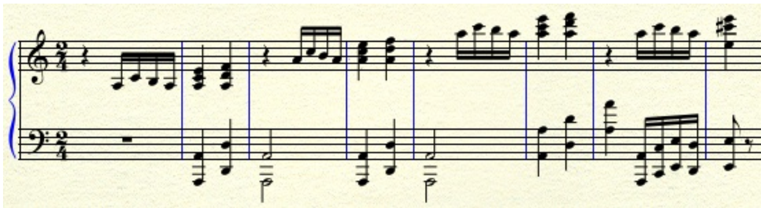
Figura 6: Versión de la introducción sin séptimas.

Escrito por Paco Gómez Martín (Universidad Politécnica de Madrid) Viernes 17 de Febrero de 2012 11:00