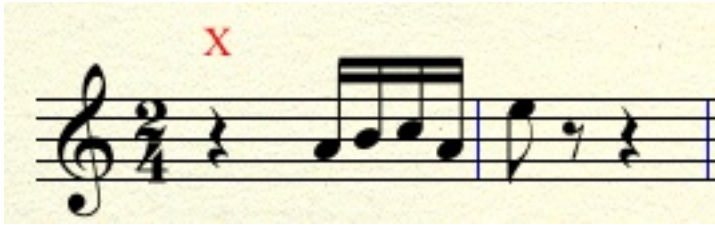
Figura 4: Motivo de la introducción.

Escrito por Paco Gómez Martín (Universidad Politécnica de Madrid) Viernes 17 de Febrero de 2012 11:00