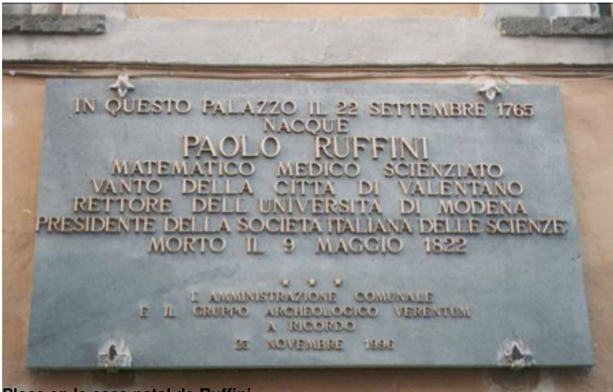
Place on the casa natal de Ruffini

Escrito por Vicente Meavilla Seguí (Universidad de Zaragoza)