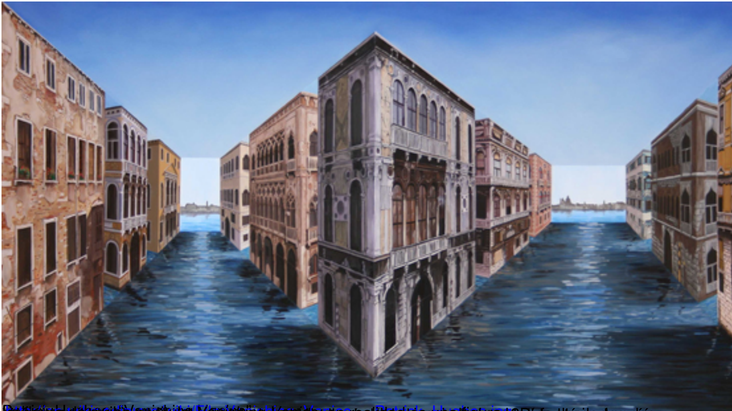
Patrick Hughes, 'Reverspectivas', 1967. Óleo sobre lienzo, 100 x 100 cm. Colección de la artista.