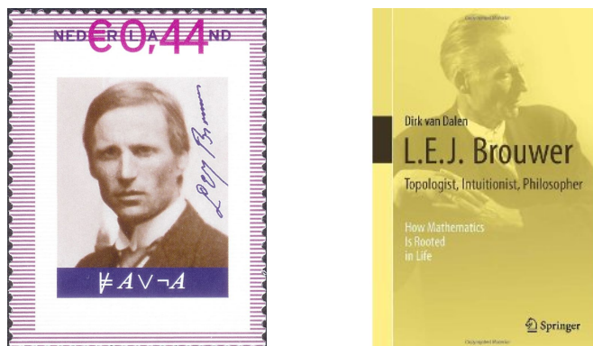
Figura 1: Brouwer en un sello y una cubierta de libro.

el «Analysis situs» [35] publicado en 1895 por Henri Poincaré (1854–1912) 2 , estuvo vinculada a la extensión de la noción de poliedro y a la clasificación de superficies, con la característica de Euler como invariante. La otra, más reciente, se inicia al estudiar Georg Cantor (1845–1918) los conjuntos lineales de puntos que son relevantes en el análisis matemático 3 . Ambas líneas de desarrollo se encontraron en la obra de Brouwer.