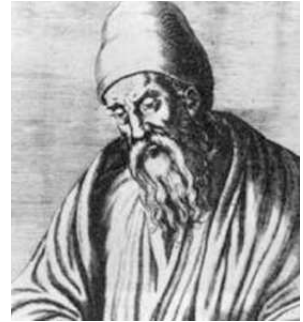
Euclides de Alejandría

Euclides había probado en el Libro IX de sus Elementos que si 2^{n+1} - 1 es primo entonces 2^n(2^{n+1} - 1) es perfecto. La contribución de Euler fue probar, unos 2000 años después, que el recíproco se cumple para los pares, es decir: