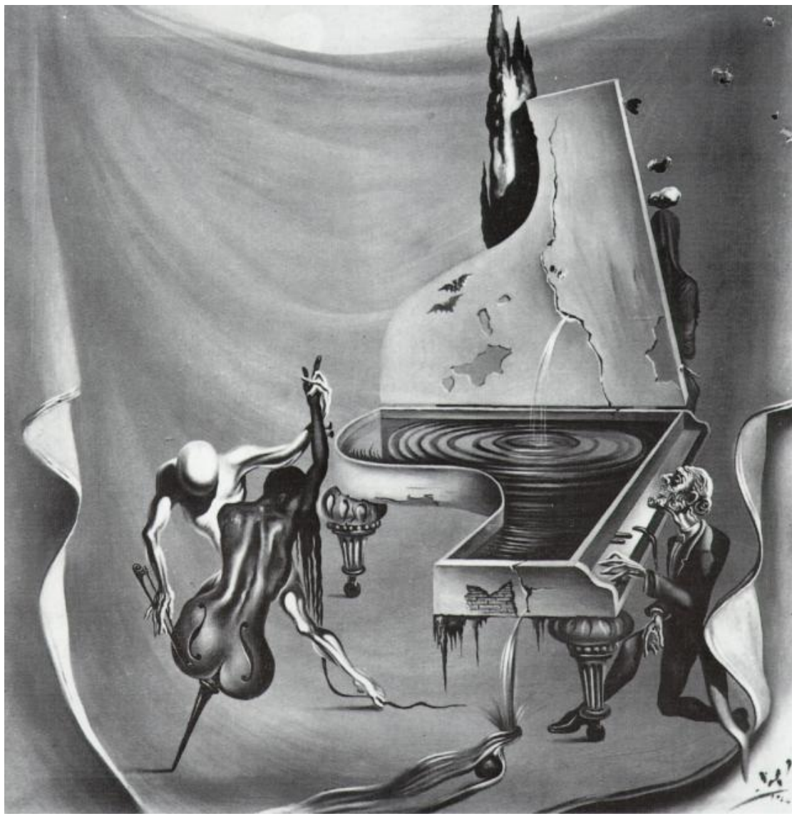
"La música - La orquesta roja - Las siete artes"; 1944. Óleo sobre lienzo; medidas desconocidas. Destruído en el incendio del Teatro Ziegfeld de New York.