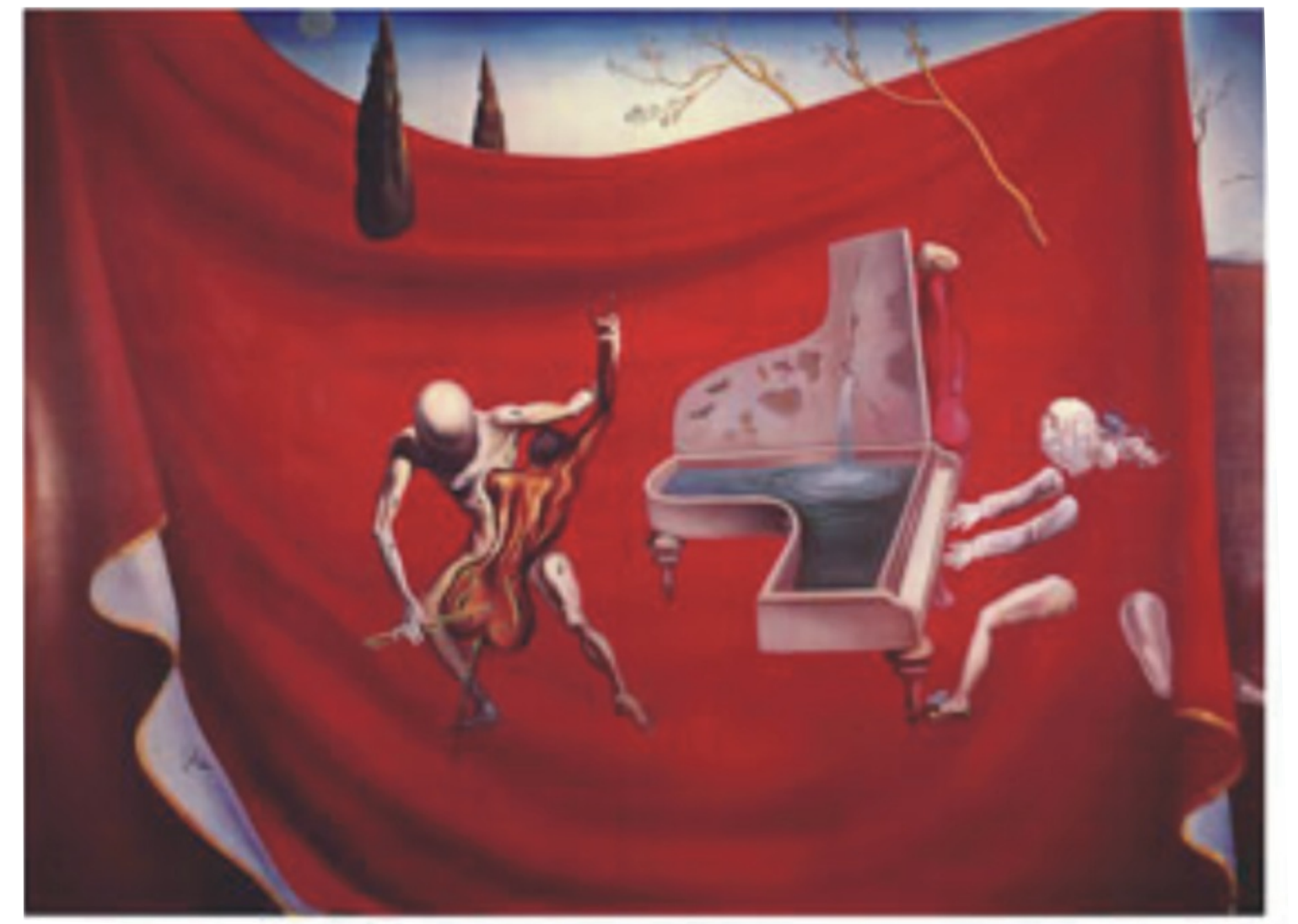
"La música - La orquesta roja - Las siete artes"; 1957 Óleo sobre lienzo; 84 x 115,5 cm. Ginebra, Colección privada.

A lo largo de la historia existieron diferentes "conjuntos instrumentales". A partir del Renacimiento estos conjuntos empezaron a organizarse, especialmente los de viento. A principios del S. XVII a las agrupaciones de viento se les añadió la cuerda, naciendo así la orquesta barroca, donde el músico que tocaba el clave llevaba el control sobre el resto de los compañeros. El director se sentaba, y con un largo y pesado bastón, marcaba el pulso dando golpes en el suelo. El Romanticismo supone la incorporación de nuevos instrumentos que aportan sonidos más expresivos y pictóricos. Berlioz y Wagner convierten la orquesta en un potente coro de metal. Además, en esta época, los directores empiezan a dirigir ya con la batuta del mismo modo que en la actualidad.