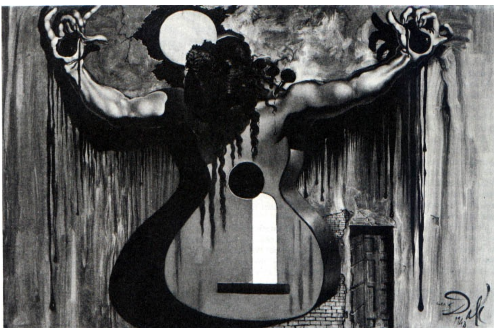
"La Guerra civil española" (Telón escénico del ballet "Café de Chinitas"); 1943 Óleo sobre lienzo; 88 x 56 cm. Colección privada

En 1943 el Ballet Theatre presenta el ballet "Café de Chinitas", sobre temas populares españoles arreglados por Lorca. Dalí realiza los decorados y el vestuario donde parece reflejarse su nostalgia por España.