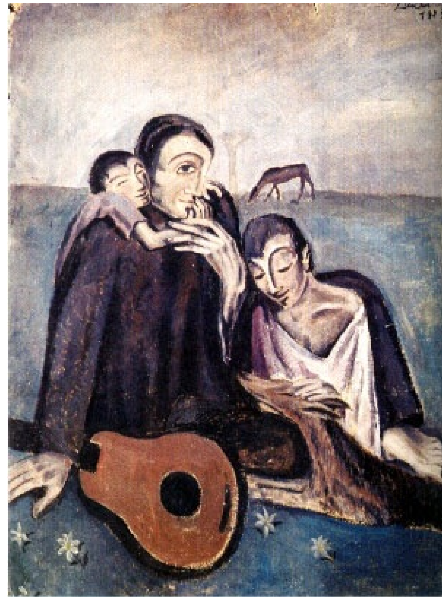
"Escena familiar"; 1923. Óleo y aguada sobre lienzo; 105x75 cm. Figueras, Fundación Gala-Salvador Dalí.

Hoy se utiliza tanto en la música popular como en la clásica, pero no es miembro de la orquesta.