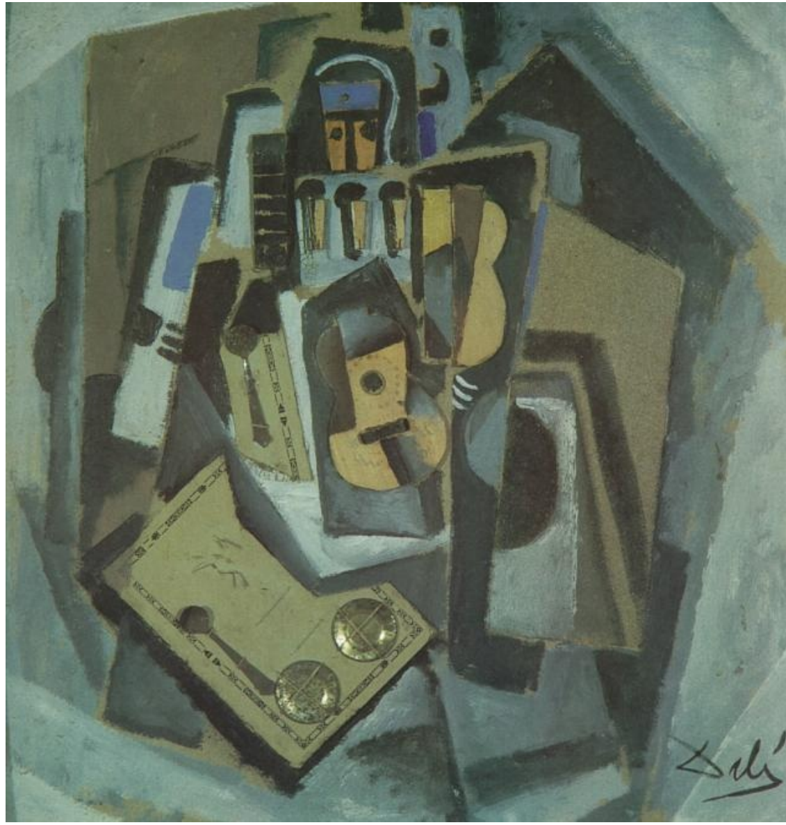
"Pierrot con guitarra"; 1924 Óleo y collage sobre cartón; 55x52 cm. Lugano-Castagnola, Fundación Thyssen-Bornemisza.