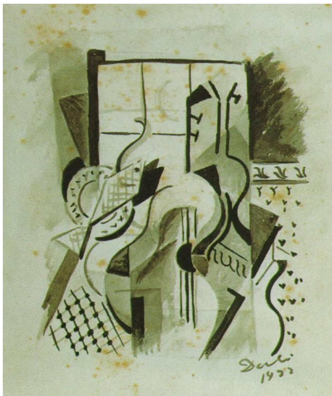
"Composición cubista-Naturaleza muerta con guitarra"; 1922 Tinta china y lápiz, lavado, sobre papel; 20,3x18,2 cm. Colección privada.

Acerca de "Naturaleza muerta al claro de luna" Dalí dice: "...En lugar de una guitarra, que es un objeto duro, he pintado una guitarra blanda, escurridiza como un pez. Este cuadro directamente influenciado por Picasso, ya muestra las prefiguraciones de mis relojes blandos..."