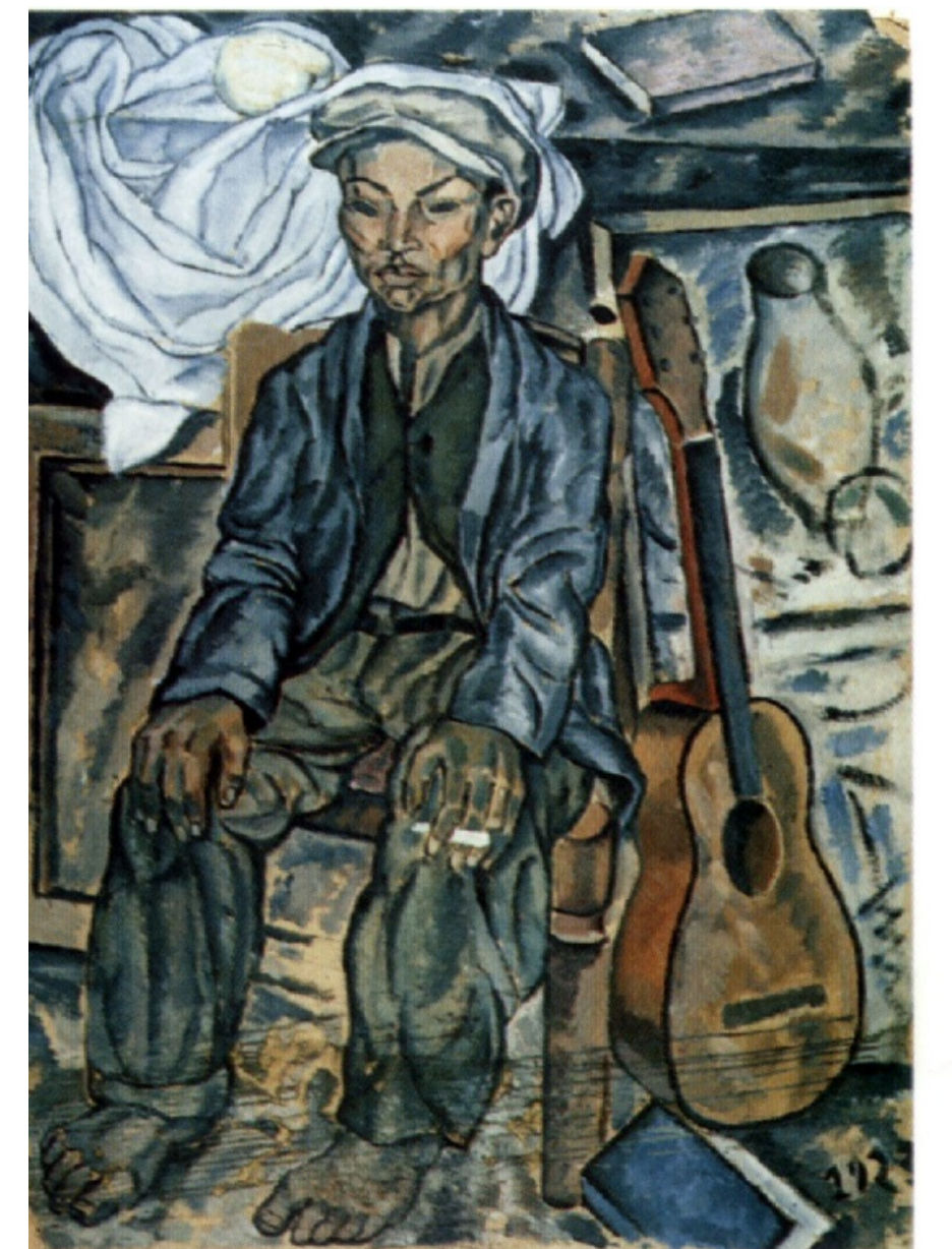
"Gitano de Figueras"; 1923 Óleo sobre cartón; 105x75,2 cm Madrid, Museo Nacional Reina Sofía.