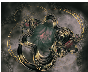
Arte Fractal: Belleza y matemáticas

Una exposición internacional realizada por iniciativa de la UNESCO