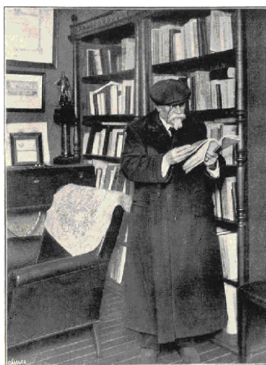
D. José Echegaray en su biblioteca. En casa de Echegaray, La Esfera n° 5, 1914