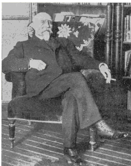
José Echegaray (1832-1916) en 1905, cuando fue designado catedrático de física matemática de Madrid.

Fuente: Nuevo Mundo 1905 n° 585 (23 de marzo) pág. sin numerar.