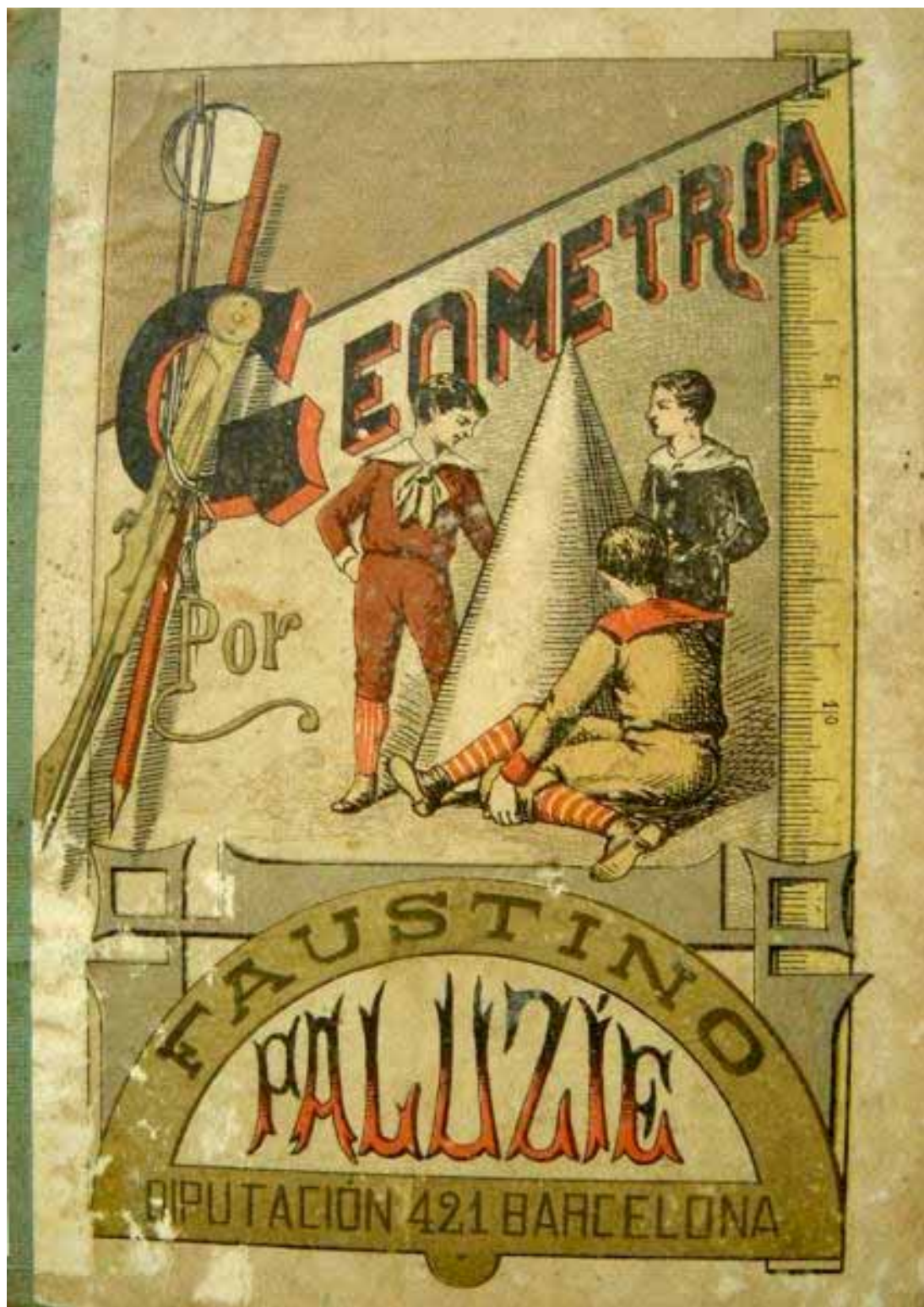
Cubierta de Elementos de Geometría puestos al alcance de los niños