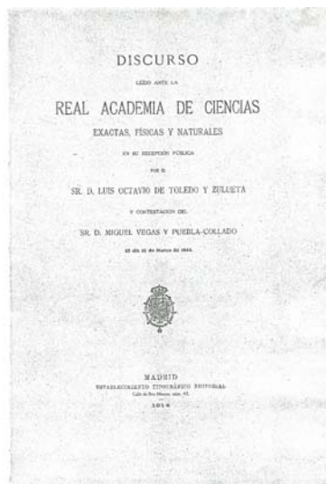
Discurso de recepción en la RACEFN (15/03/1914).