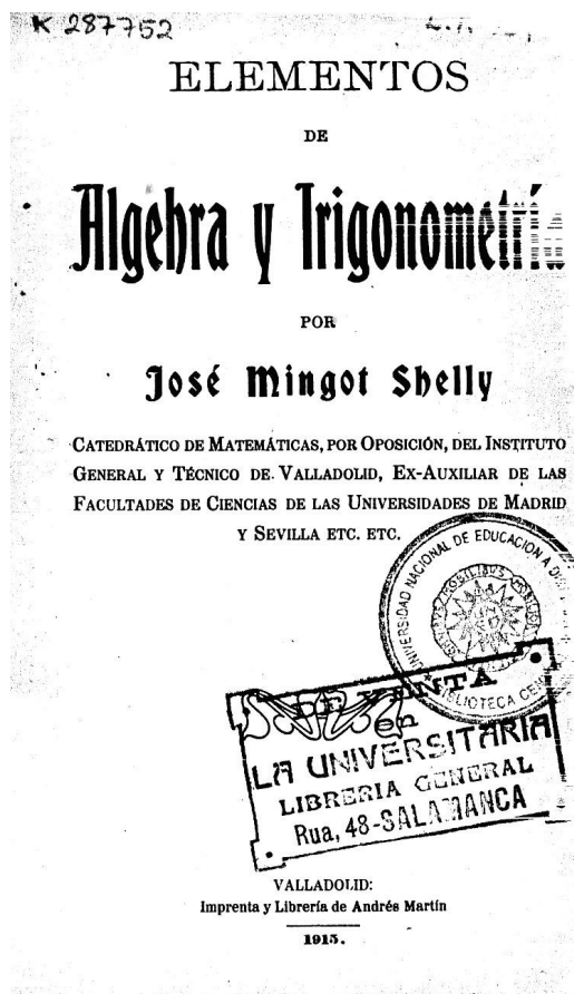
Figura 2: Elementos de Álgebra y Trigonometría , de J. Mingot (portada).