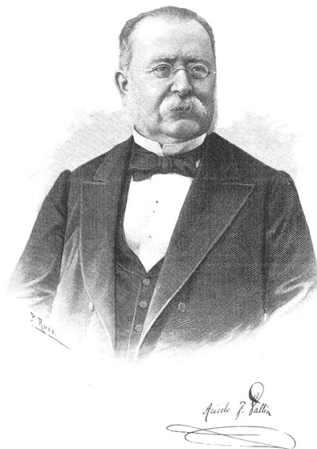
Figura 3: Acisclo Fernández Vallín y Bustillo [14].

propició que el Instituto consiguiera sendos premios en la Exposición Universal de Filadelfia y en la Exposición Universal de París [23].