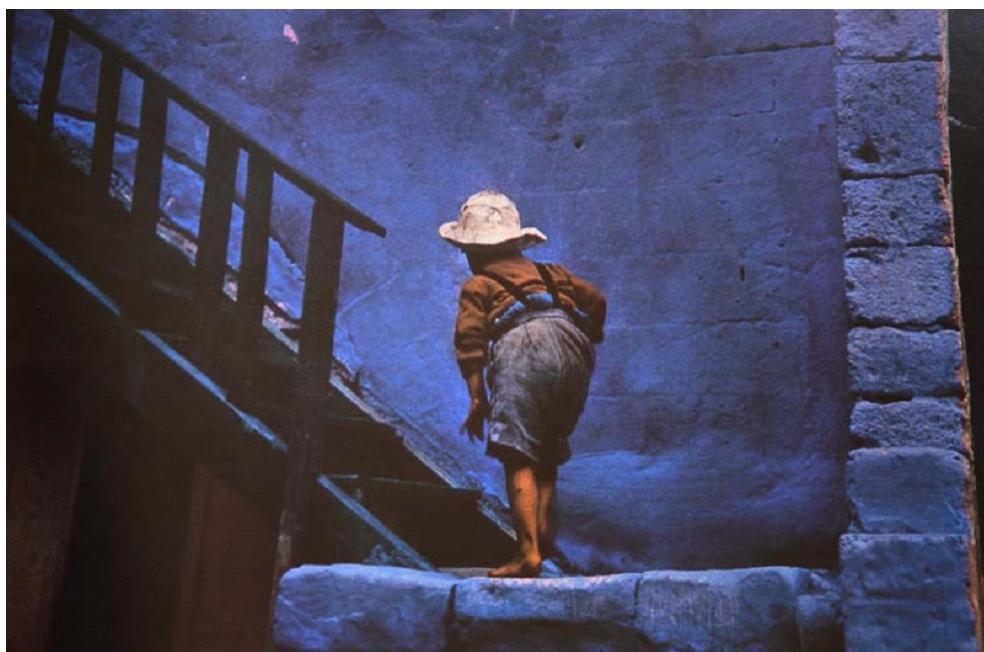
Figura 4: Ernst Haas, Rodas, Grecia , 1960.