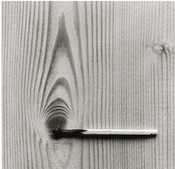
Figura 6: Chema Madoz, Madrid , 1994.