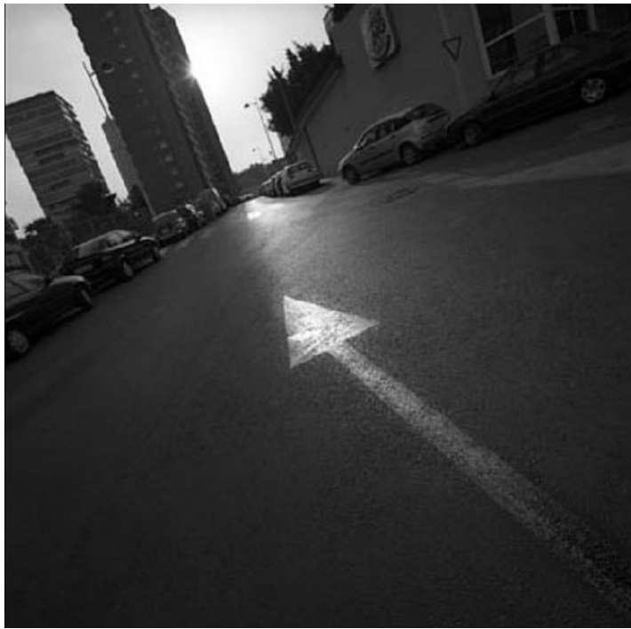
Figura 5: Enrique Algarra.