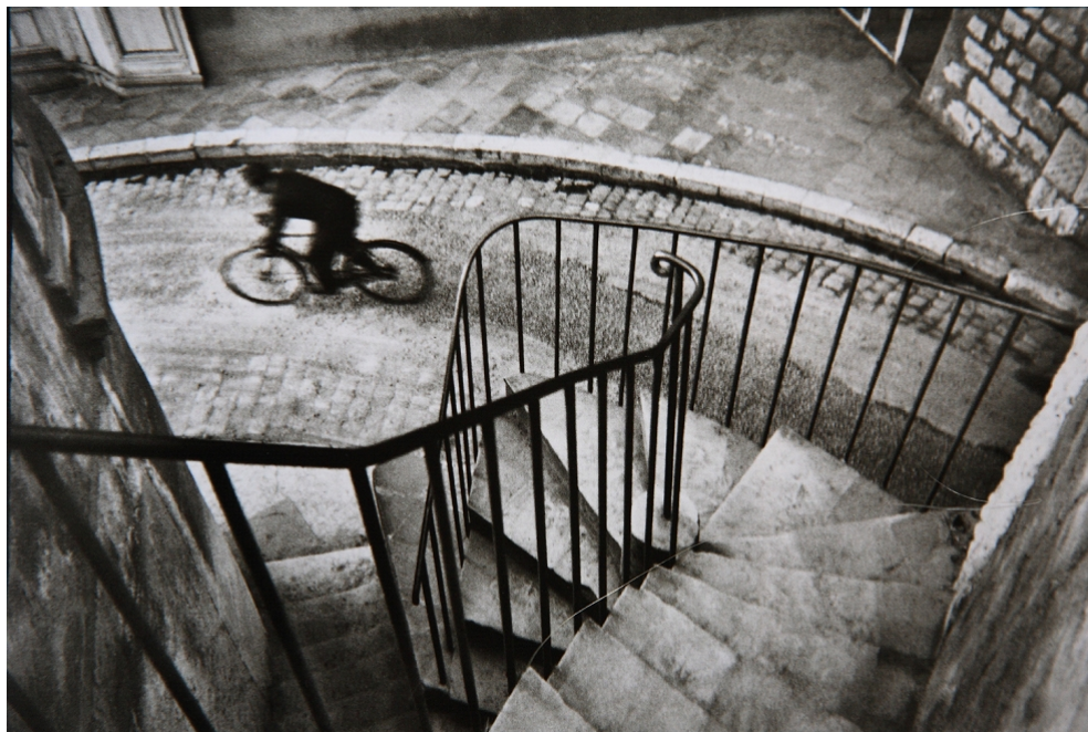
Figura 3: Henri Cartier-Bresson, Hyères, Francia , 1932.