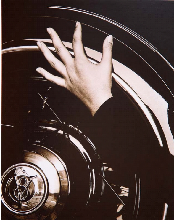
Figura 1: Alfred Stieglitz, Georgia O'Keeffe , 1933.