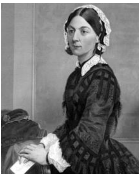
Pintura de Florence Nightingale inspirada en una fotografía - WIKIPEDIA

Pero la pequeña Florence desde muy pequeña sintió una atracción irrefrenable por las ciencias y, en particular, por las matemáticas. Principalmente, por la estadística descriptiva. Se dedicaba a clasificar las conchas que recogía, anotando datos sobre ellas y creando tablas llenas de números con las distintas medidas y características de dichas conchas.