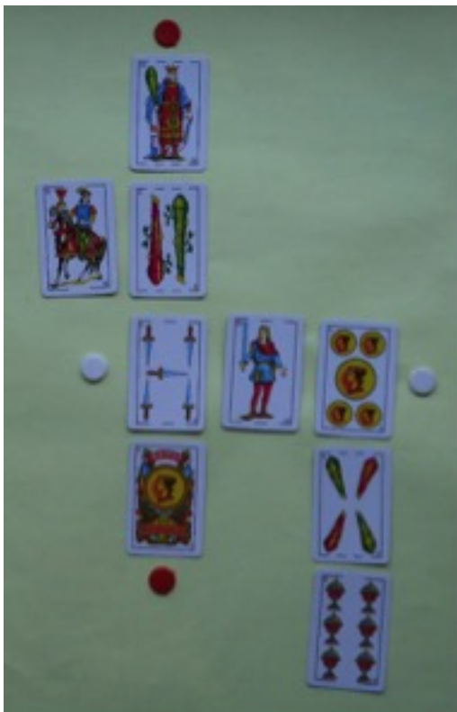
Imagen 2: Partida incompleta del árbol del 20.

Gana el primer jugador que consigue colocar sus fichas, es decir, que consigue tres veces 20 con la suma de las cartas.