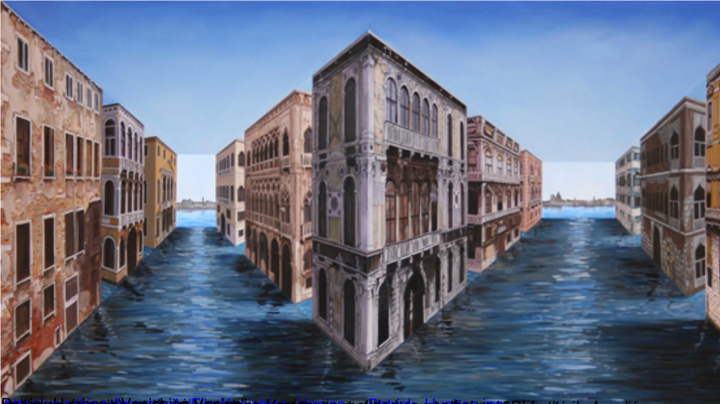
Patrick Hughes, 'Reverspectivas', 1967. Óleo sobre lienzo, 100 x 100 cm. Colección de la artista.